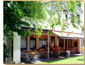
NaturFreunde Haus Friedrichshafen