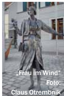
„Frau im Wind“

... wanderten insgesamt achtzehn FreundInnen am 19. Januar. Aufhänger für diese Tour ist die Tatsache, dass sich Franz Marc (bekannt für seine farbigen, kubistischen Tierdarstellungen) mehrmals in Markt Indersdorf aufhielt. Hier entstand ein Gemälde mit dem Bildtitel Indersdorf. Es zeigt das Gasthaus zur Mühle im Dorf Glonn (heute ein Ortsteil von Markt Indersdorf) und die Glonn im Vordergrund, über die eine Brücke führt. Es entstand 1904 und ist eines der wenigen