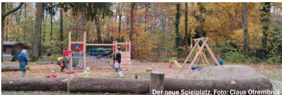
Der neue Spielplatz.

Natürlich nicht zu vergessen die zahlreichen Helfer aus den Reihen der NaturFreunde und Spielplatznutzer. Wir bitten um Anmeldung bis zum 25. April 2022 in der Geschäftsstelle unter info@nfbm.de oder Tel. 089-2015777.