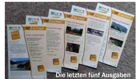
Die letzten fünf Ausgaben