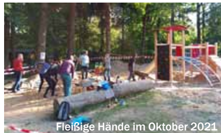
Fleißige Hände im Oktober 2021

Deshalb möchte ich mich an dieser Stelle herzlich bedanken bei den Mitgliedern des Bezirksausschusses und der Evangelisch-Lutherischen Kirchengemeinde der Passionskirche München (Thalkirchen-Obersendling).