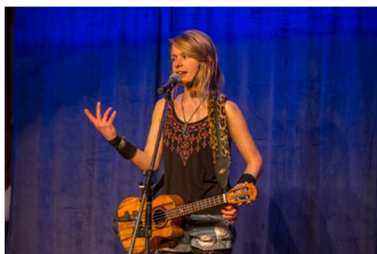
Zehentscheuer Linkenheim-Hochstetten, 08.03.19